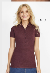
PHOENIX WOMEN 01709