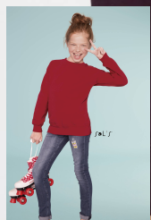
NEW SUPREME KIDS 13249